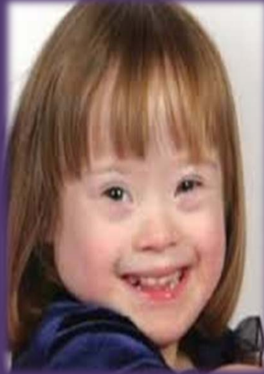
الإعاقات الذهنية التوحد صعوبات التعلم الشلل الدماعي